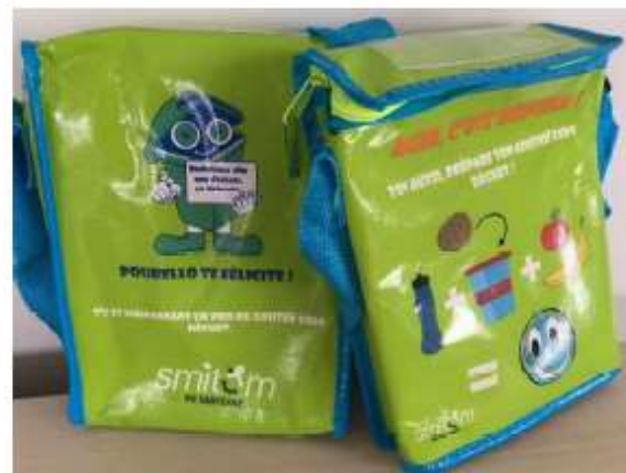
Sac à goûter réutilisable