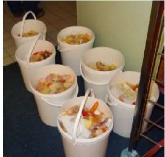
Seaux de gaspillage alimentaire lors de pesées de diagnostic réalisées par le SMITOM du Santerre