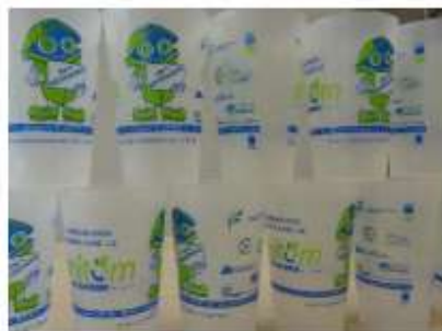
Eco-gobelets à l'effigie du SMITOM du Santerre