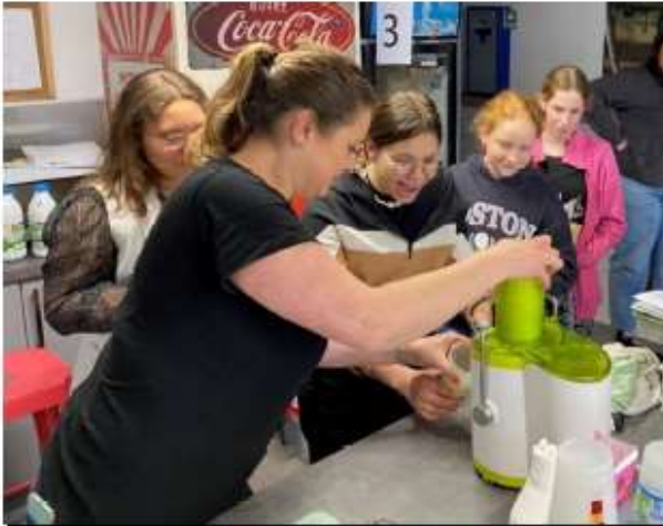
Réalisation de recettes anti-gaspi dans une structure située sur le territoire du SMITOM du Santerre