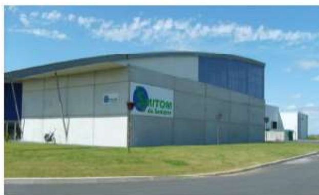
Centre de tri du SMITOM du Santerre ouvert en 2007