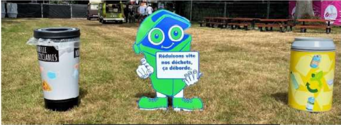
Poubelles pédagogiques mis à disposition lors d'un évènement grand public partenaire du SMITOM du Santerre