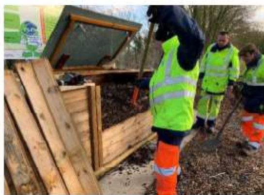
Utilisation des composteurs de gros volumes mis en place par le SMITOM du Santerre