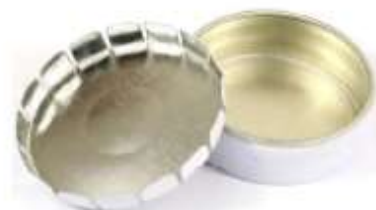
Exemple de boîte à mégot réutilisable