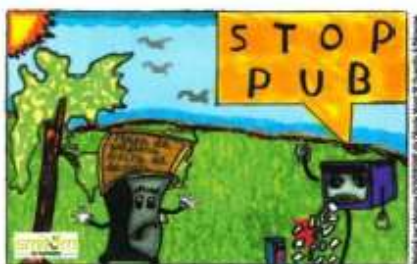
Stop-pub actuel du SMITOM du Santerre