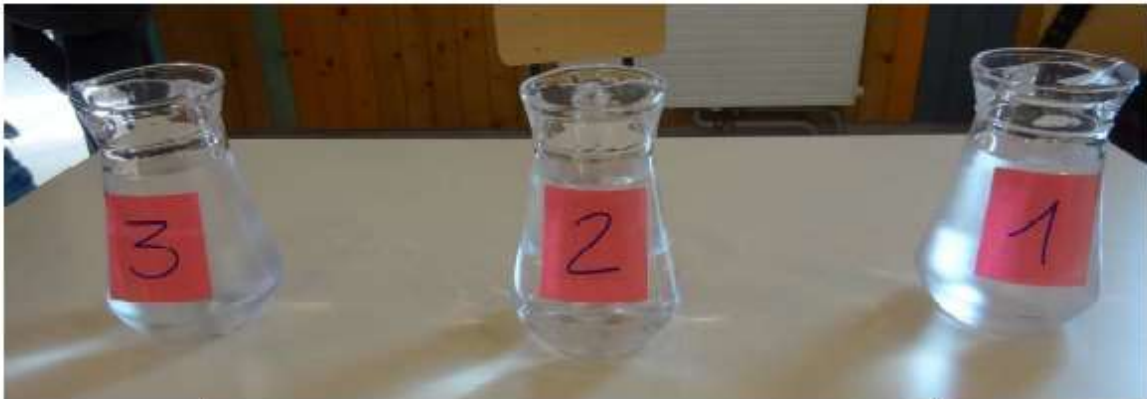
Bar à eau proposé lors d'évènement grand public partenaire du SMITOM du Santerre