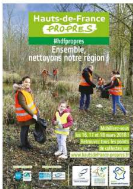
Affiche des Hauts-de-France propres 2018